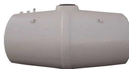
Depósito horizontal enterrado.